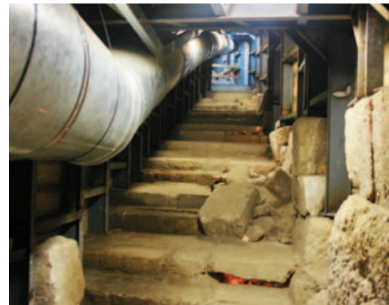
Nur teilweise konnte die antike Strasse, die vom Siloah-Teich bis zum Tempelberg hinaufführte, freigelegt werden. Auf diesen Stufen hat Jesus gestanden und die Menschen aufgefordert, an ihn zu glauben.

brachte es unter dem Jubel der Festtagspilger zum Tempel. In Johannes 7,37 ff. lesen wir: «Am letzten, dem grossen Tag des Festes, aber stellte sich Jesus hin und rief: «Wen da dürstet, der komme zu mir, und es trinke, wer an mich glaubt. Wie die Schrift [vom Messias] sagt: Aus seinem Leib werden Ströme lebendigen Wassers fliessen.» Wie werden die Festtagspilger gestaunt haben über diese Worte, denn damit erhob Jesus den Anspruch, der Messias zu sein, was einige dann auch glaubten, andere aber vehement ablehnten (Johannes 7,40 ff.). Jesus ist die Quelle des Lebens und wir sollen nicht in trüben Quellen fischen, denn in keinem anderen Namen ist das Heil zu finden.