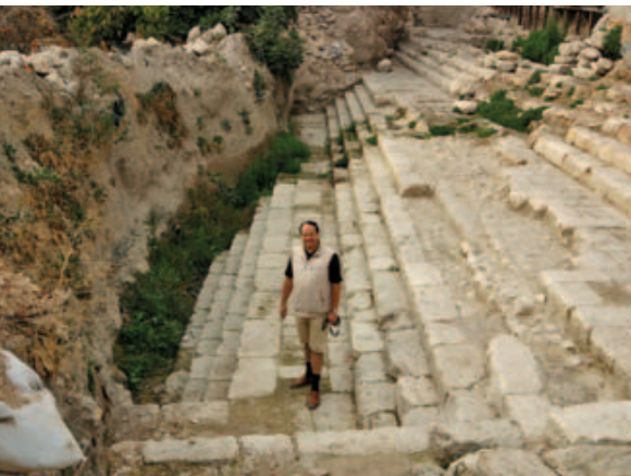
Im Sommer 2004 wurde der Siloah-Teich im Süden der Davids-Stadt entdeckt. Über die Stufen gelangte man in das Ritualbad, das in Johannes 9 erwähnt wird.