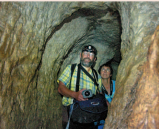
Der Treffpunkt der beiden Bautrupps, deutlich erkennbar an der unterschiedlichen Höhe des Tunnels.

sammelt, der ein grosses Becken war. Hier konnten die jüdischen Frauen nun das lebenswichtige Wasser schöpfen – ohne jegliche Gefahr, denn der Siloah-Teich lag innerhalb der schützenden Stadtmauer. Dieser geheime Hiskia-Tunnel garantierte das Überleben in Zeiten feindlicher Belagerung der Stadt. Jesaja, einer der Zeitgenossen von König Hiskia, spricht von dem «Wasser von Siloah, das still dahinfließt» (Jes. 8,6). Jerusalem wurde vor den Assyrern gerettet. Aber der Prophet Jesaja schalt das jüdische Volk, dass sie die Rettung mehr ihren eigenen Verteidigungsanstrengungen zuschrieben als der Bewahrung Gottes: «Ihr macht ein Sammelbecken zwischen den beiden Mauern für die Wasser des alten Teiches. Aber ihr blickt nicht auf den, der es getan, und seht den nicht an, der es lange vorher gebildet hat» (Jes. 22,11).