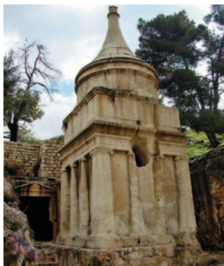
Das sog. Absalom-Grab im Kidrontal war Jahrhunderte bis zur Hälfte unter Steinen begraben. Heute ist es komplett freigelegt.

Wir verlassen nun die Davids-Stadt und gehen durch das Kidrontal hinüber zum Ölberg. Dabei kommen wir vorbei an Monumentalgräbern aus dem 2. und 1. Jh. v. Chr. Der Tradition nach wird das nördlichste der Gräber als Absalom-Grab und das südliche als das Zacharias-Grab bezeichnet. Aus Abscheu vor Absalom und dem versuchten Mord an seinem Vater König David wurde über Jahrhunderte das Grab von Vorübergehenden mit Steinen beworfen. Zu Beginn des 20. Jh. war das Grab bis zur Hälfte bedeckt. Und beim Zacharias-Grab hatte man viele Gräber davor errichtet. Auch dieses Grab war bis zur Hälfte verschwunden. Erst 1924 wurden die Grabanlagen freigelegt. Es handelt sich um Priestergräber aus der Makkabäerzeit.