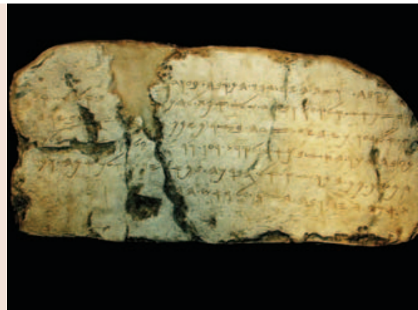
... die im Museum von Istanbul aufbewahrt wird. Die Inschrift berichtet von dem Aufeinandertreffen der beiden Bautrupps.