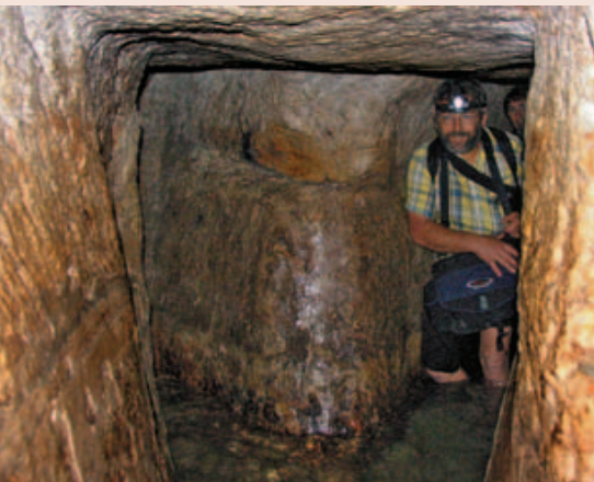
Mehrere «Nothaltebuchten» (links im Bild) sind im Tunnel verteilt, damit die Arbeiten ununterbrochen ausgeführt werden konnten.