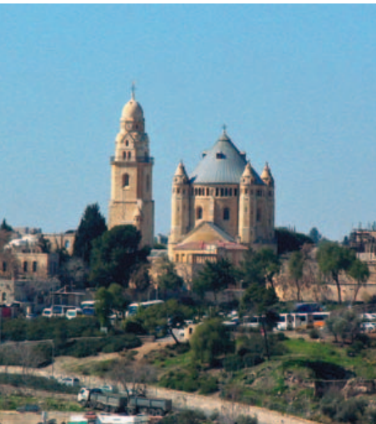
Der moderne «Zionsberg» mit seinen katholischen Kirchen. Auf diesem Berg wurde fälschlicherweise das Davids-Grab lokalisiert. Die Tradition des Abendmahlssaales ist hingegen historisch gesicherter.

David») leben heute knapp 20 jüdische Familien (oft als «Siedler» bezeichnet). Grosse Teile der Davids-Stadt hatte zu Beginn des 20. Jahrhunderts der jüdische Bankier Baron Rothschild gekauft. Bis zur Zeit der jordanischen Besatzung (1948–1967) lebten hier nur wenige arabische Familien. Das änderte sich mit der vollständigen Vertreibung der Juden 1948 (auch aus der Altstadt wurden alle Juden von den Jordanern vertrieben). Erst durch den Sechs-Tage-Krieg 1967 kam die Davids-Stadt, wie auch die anderen Teile Ost-Jerusalems (u. a. die Altstadt mit der Klagemauer), wieder in die Hände der Israelis. Neben dem Tempelberg ist daher die Davids-Stadt einer der Brennpunkte des Nahostkonflikts zwischen Israelis und Palästinensern. Wie so oft, wird auch hier erbittert um die Frage gestritten: Wem gehört das Land? Ausgrabungen in der City of David können daher nicht selten Anlass für eine politisch brenzlige Lage sein im Streit um Jerusalem.