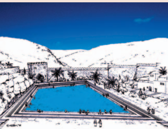
Rekonstruktion des Siloah-Teiches zur Zeit Jesu.

freilegen. Vor wenigen Monaten gelang ihm ein weiterer bedeutender Fund. Es wurde die Strasse mit den antiken Treppeinstufen entdeckt, die vom Siloah-Teich bis direkt zum Tempelberg hinaufführte.