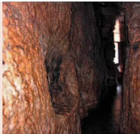
Am Ende des Tunnels wurde 1880 eine Inschrift entdeckt. Heute erinnert nur noch eine Ausbuchtung an die Steintafel, ...