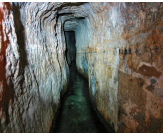
Der Beginn des 533 m langen Hiskia-Tunnels. Er ist so schmal, dass man den Tunnel nur in einer Richtung begehen kann.